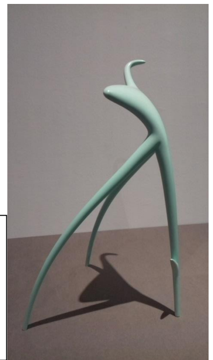
Assis /debout de Philippe STARCK en acier laqué

Devant cet « assis-debout » de P. STARCK, nous avons cherché tout ce à quoi il nous faisait penser ainsi que son ombre portée.... Certains voyaient une plante, une racine, un Alien, une dent.... Ce drôle de tabouret est en acier laqué.