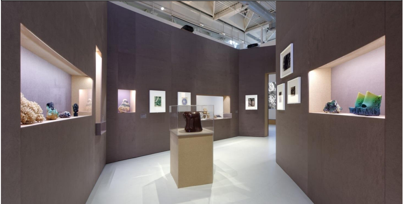
Cabinet de curiosités du XXIe siècle

Nous sommes ensuite entrés dans un cabinet de curiosités où étaient conservés différents objets curieux ainsi que des photos....On a pu y voir une éponge de mer, des coraux, des macros photographies, des croquis des tissus ainsi que des chaussures fabriquées à l'aide d'une imprimante 3D.... Toutes ces choses étaient très étonnantes. Leur point commun était la nature : des objets curieux trouvés dans la nature et des objets étranges fabriqués en s'inspirant de la nature.