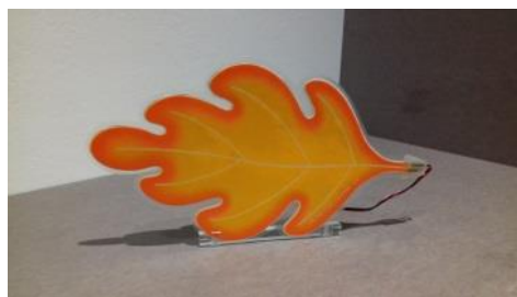
Lampe feuille : A. Branzi

Pour dessiner de belles formes, le designer peut s'inspirer de la nature en utilisant des matériaux naturels qui se mêleront à des matériaux fabriqués par l'homme comme dans le banc ci-dessus. Les branches d'arbre sont à la fois utilitaires (le pied du banc) et ornementales.